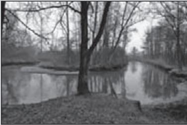
De 'marathon' van Dommelen