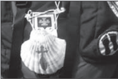
De aanloop naar Santiago