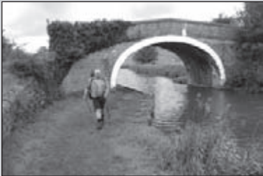
Op stap met Piet Jansens