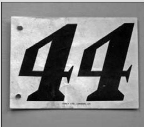
Antiek wedstrijdnummer van papier dat nog door Cornelis van Montfort is gebruikt, in Engeland

„Ik heb het zelf aangeboden, want ik vind het gewoon leuk”, zegt hij. Een goede tip heeft hij ook: „Eerst met een ui het textiel bewerken, dan loopt de verf niet uit.” En als het klaar is, moest er misschien ook maar eens statiegeld geheven worden op die nummers, zodat ze minder vaak kwijt raken.